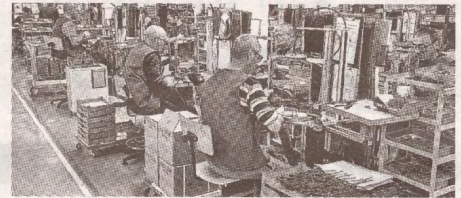
Предприятию, стоявшему у истоков >>> с.7 молдавской промышленности – 80 лет