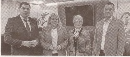
Федерация SIBA выступает за реальный и качественный социальный диалог >>> с.5