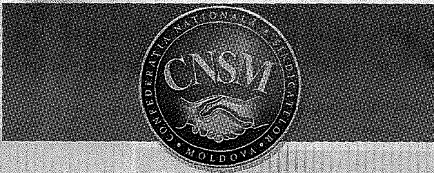
PUBLICAȚIE PERIODICĂ A CONFEDERAȚIEI NAȚIONALE A SINDICATELOR DIN MOLDOVA