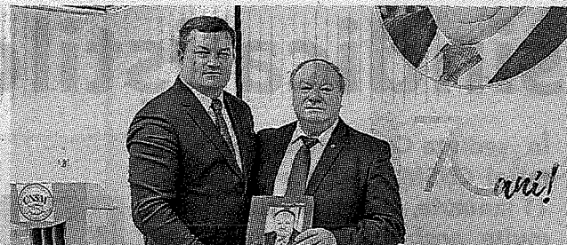
„Mărturii peste timp”, o carte despre o viață de Om consacrată sindicatelor >> p.3