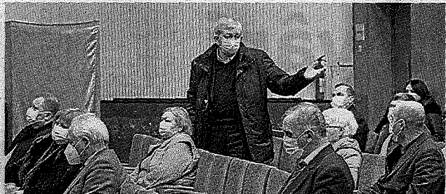
Problemele legate de refacerea sănătății sindicaliștilor, discutate la vârf >> p.2