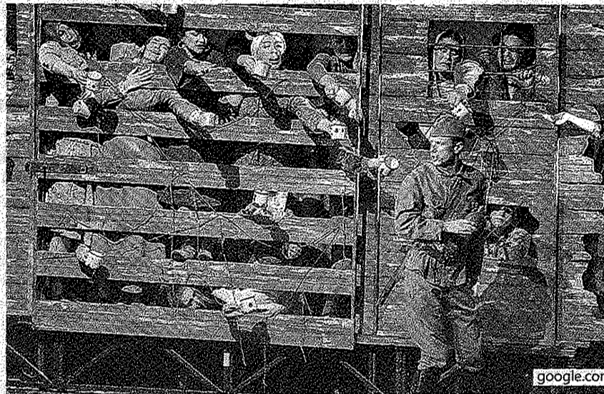
Spectacolul „Dosarele Siberiei” redă o tragedie din trecut, dar care este resimțită și azi de mii de oameni.

Expertii citați în raport menționează că susținerea cu bani publici a culturii a scăzut încă din anii dinaintea