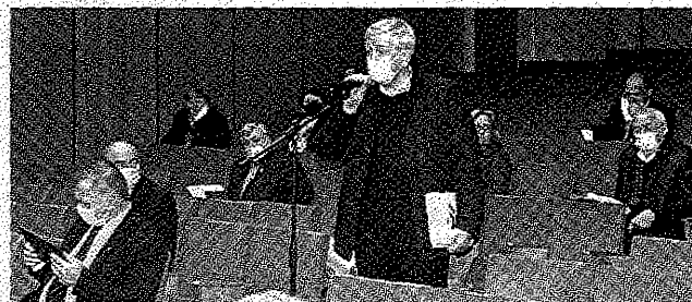
Comitetul Confederal a dezbătut >> p.2 chestiuni ce vizează întreaga societate