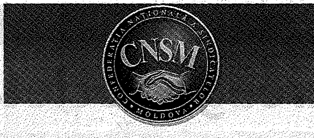
PUBLICAȚIE PERIODICĂ A CONFEDERAȚIEI NAȚIONALE A SINDICATELOR DIN MOLDOVA