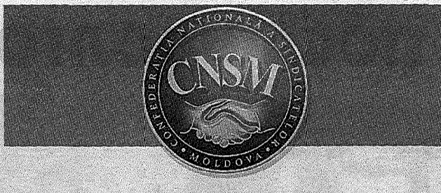
ПЕРИОДИЧЕСКОЕ ИЗДАНИЕ НАЦИОНАЛЬНОЙ КОНФЕДЕРАЦИИ ПРОФСОЮЗОВ МОЛДОВЫ