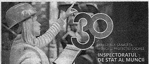
Государственная инспекция труда – 30 лет деятельности