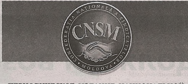
ПЕРИОДИЧЕСКОЕ ИЗДАНИЕ НАЦИОНАЛЬНОЙ КОНФЕДЕРАЦИИ ПРОФСОЮЗОВ МОЛДОВЫ