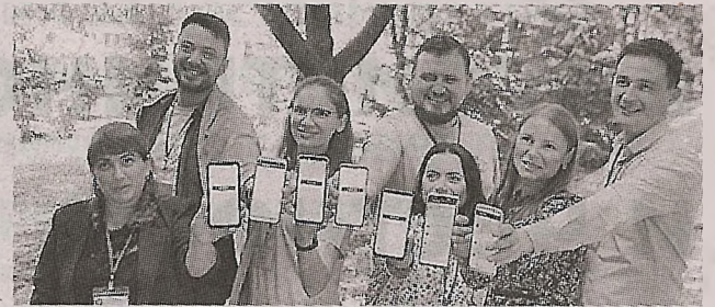
Профсоюзы запустили приложение «Права работников» >> с.5