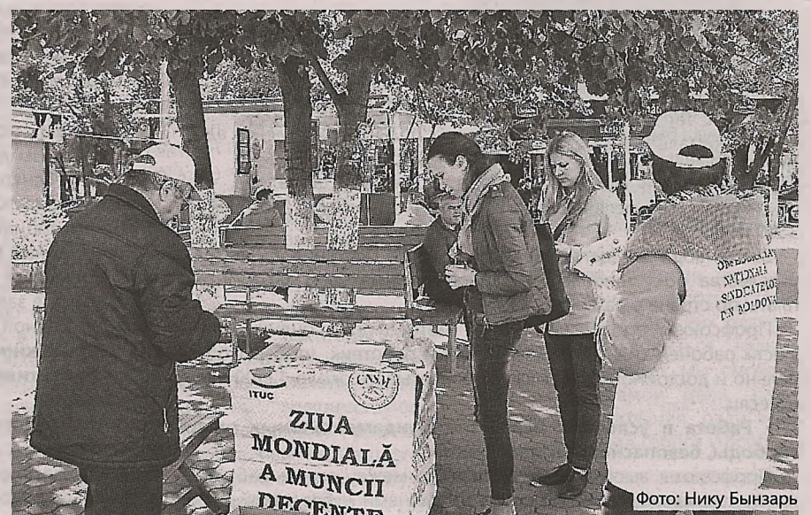
Фото: Нику Бынзарь