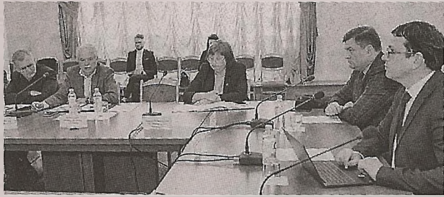
CNSM предлагает установить минимальную зарплату в размере 5000 леев >> с.3