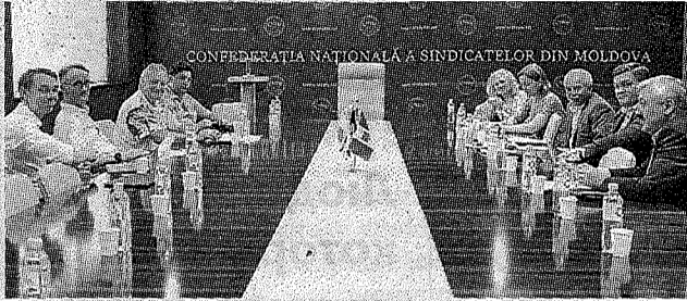
Лидеры CNSM провели конструктивные дискуссии с коллегами из Дании >> с.3