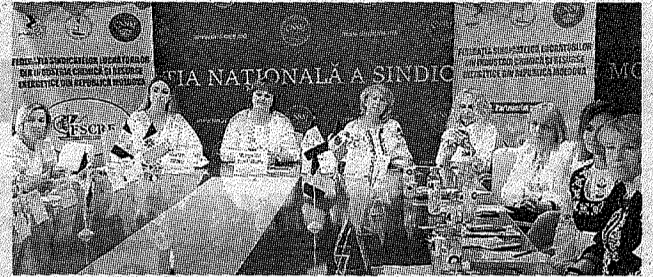
Безопасность труда – тема собрания Женской комиссии FSCRE >> с.7