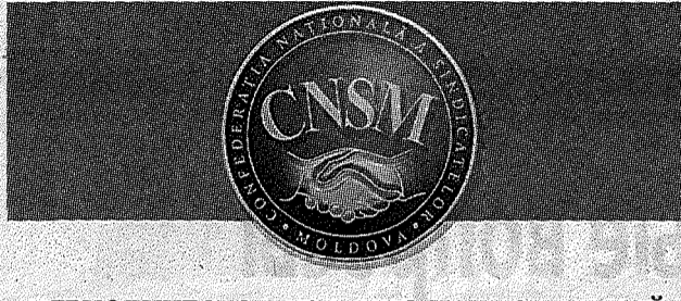
ПЕРИОДИЧЕСКОЕ ИЗДАНИЕ НАЦИОНАЛЬНОЙ КОНФЕДЕРАЦИИ ПРОФСОЮЗОВ МОЛДОВЫ