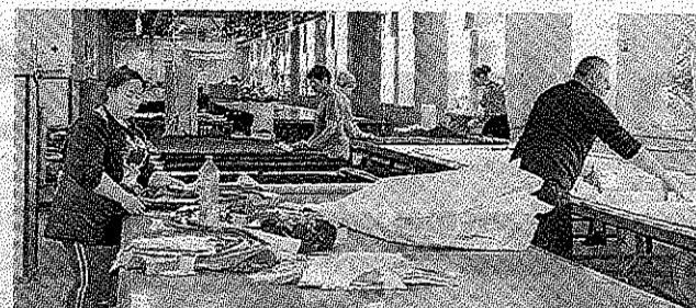
Egalitatea de gen: progres în politică, regres pe piața muncii