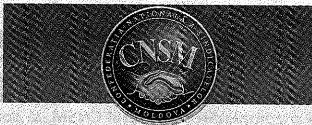
PUBLICAȚIE PERIODICĂ A CONFEDERAȚIEI NAȚIONALE A SINDICATELOR DIN MOLDOVA