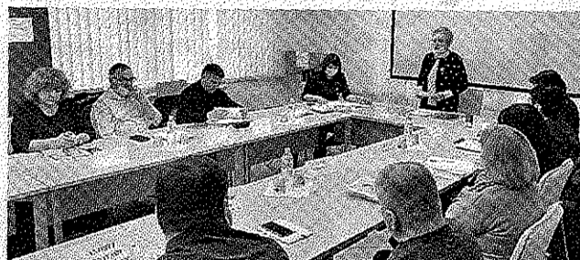
„SINDINCOMSERVICE” și-a trasat obiective pe viitor